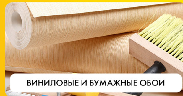
ВИНИЛОВЫЕ И БУМАЖНЫЕ ОБОИ